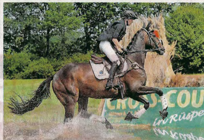
Die Teilnehmer müssen verschiedenste Hindernisse überwinden.

Wir fördern den Sport, besonders den Ruder- und Reitsport