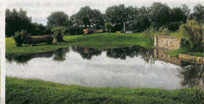
Der neu angelegte Teich auf der Vereinsanlage

Die Vorbereitungen der Vereinsmitglieder für das Turnier laufen bereits. Alle packen tatkräftig mit an. Für Verpflegung ist an allen Veranstaltungstagen gesorgt, der Eintritt ist frei. Die nächste Veranstaltung des Vereins ist ebenfalls schon in Planung. Vom 17. bis 20. September wird die Deutsche Meisterschaft der Vielseitigkeit und eine international ausgeschriebene CIC*-Vielseitigkeitsprüfung ausgerichtet.