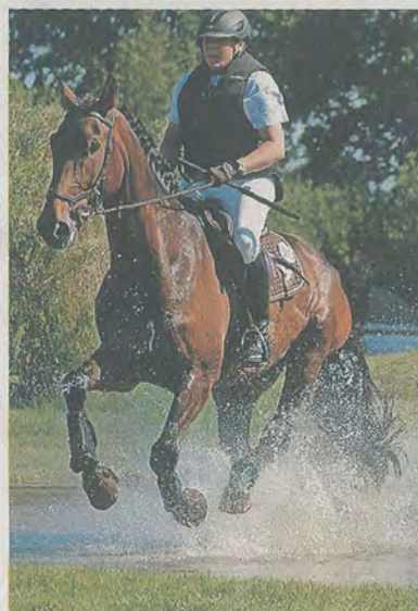
...und wenig später durch einen Teich.

Von Vorteil sei auch, dass der Reiter mit seinem Ross die Strecke im Schritt abreiten und dem (jungen und oft unerfahrenen) Pferd beispielsweise die Hindernisse im Feld oder den neu ange-