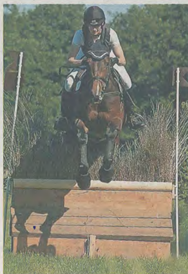
Für Reiter und Pferd geht's unter anderem über ein Hindernis...